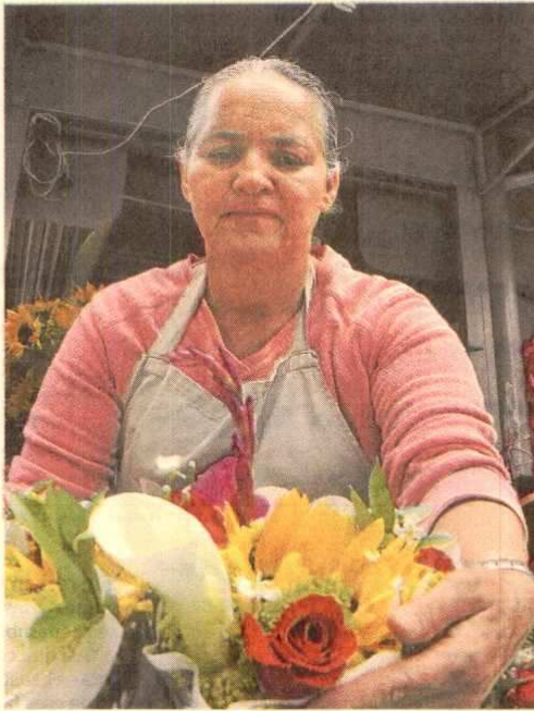
Los datos se entregan en la antesala del Día Mundial del Trabajo Decente, que se celebra hoy, 7 de octubre.

La investigación 'Los retos del trabajo decente en el contexto colombiano', señala que el diseño de la política de intervención laboral debe enfocarse en la corrección de las brechas que derivan de la informalidad rural y el enfoque asistencial, que debe ser progresivamente sustituido por estímulos a la formalidad y el acceso a las modalidades