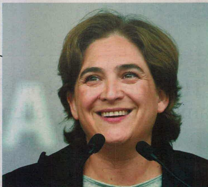
Ada Colau, alcaldesa de Barcelona desde 2015, es ponente en la Cumbre de Bogotá.

“A la cumbre debemos aportar que se tomen en serio la participación de las ciudades en la gobernanza global”, concluye la alcaldesa de Barcelona. El debate sobre el devenir de las ciudades pasa ahora a manos de Quito. ▀