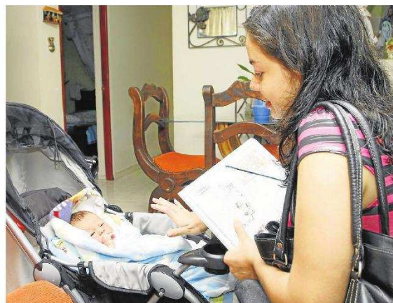
Para solicitar las 18 semanas completas, la trabajadora debe reportar ante el empleador el inicio del estado de embarazo, el día en el que probablemente nacerá el bebé y el día en que empezará la licencia.

En esta misma línea, Jorge Arias, gerente general de Oracle para Colombia y Ecuador, explicó: "Para nosotros es muy importante el papel de las mujeres, no solo por su aporte profesional, sino además por su contribución al desarrollo de la sociedad. Si ellas pueden dedicar más tiempo al cuidado de los niños, tendremos mayores posibilidades de tener una juventud sana y mejor preparada para los