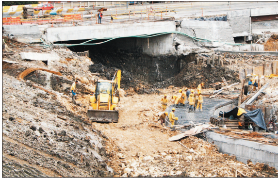
CONALVIÁS SE vio involucrada en el llamado 'carrusel de contratos' en la fase tres de Transmilenio, que recorre la Avenida Eldorado de Bogotá.

Así mismo procura suspender todos los efectos que se derivan de este fallo, como es la exclusión del Boletín de Responsables Fiscales y el desembargo de la maquinaria por valor de 130.000 millones de pesos, medida que se