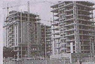
En Barranquilla hay proyectos en prevención, en construcción y unidades listas para entregadas.

Según el reporte de Coordinada Urbana, el segmento VIS tuvo un incremento anual de 11,6%, impulsado en mayor medida por el rango correspondiente al programa Mi Casa Ya - Cuota Inicial y en el cual aplica también el subsidio a la tasa de interés, segmento que reportó una