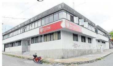
Para reiniciar labores, se deberá cumplir las medidas exigidas por el Ministerio.

Encontraron falta de iluminación, cableado eléctrico suelto y un riesgo de caída de objetos de alturas, sin demar-