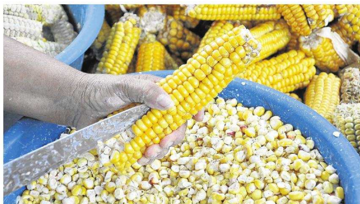
Al menos 30 mil toneladas de maíz almacenadas quedan por ser comercializadas en el país, dijo Pineda.

DATO Pineda dijo que se han comercializado unas 20 mil toneladas de maíz desde que el ministro Aurelio Iragorri ordenó acompañar a los productores.