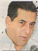
DUMECK TURBAY, GOBERNADOR DE BOLÍVAR.