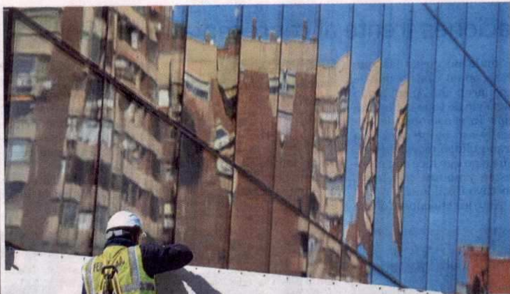
La construcción sostenible es una exigencia para preservar el equilibrio de los entornos.

Camacol celebrará 60 años de su creación.