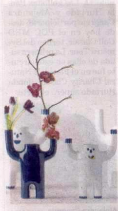
Diseño de Jaime Hayón, 'b.d'.

El evento de esta ciudad italiana espera tener 400.000 visitantes hasta el domingo, día en que termina. Desarrollará muestras, exposiciones, charlas y espectáculos y contará con la participación de firmas como Philippe Starck, Patricia Urquiola, Tokujin Yoshioka.